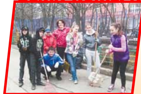
В Москве объявлен месячник по благоустройству, а 12 и 26 апреля горожан призывают с метлами и лопатами помочь навести порядок в столице.