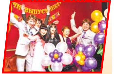
Каждый год в конце июня мы отправляемся на бал. Повседневная школьная жизнь внезапно становится блестящей, торжественной и немного сказочной.