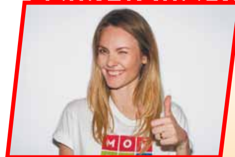
8 июня 2014 года прошли предварительные выборы кандидатов в депутаты Московской городской Думы, в которых смогли принять участие все жители Москвы.